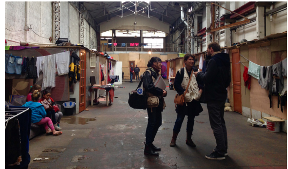
L'équipe de la mission bidonvilles de Médecins du Monde

constat d'une détérioration des conditions de vie des personnes vivant en campement en Ile-de-France, avec notamment des problématiques nouvelles de santé, en particulier pour les jeunes .