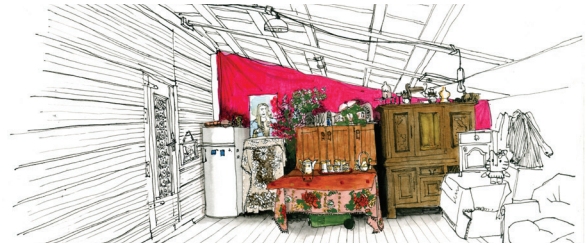
Un bidonville - Illustration: Cendrine Bonami-Redler

Source: « De baraque en Baraque - Voyage au bout de ma rue », La Ville Brûle, 2014