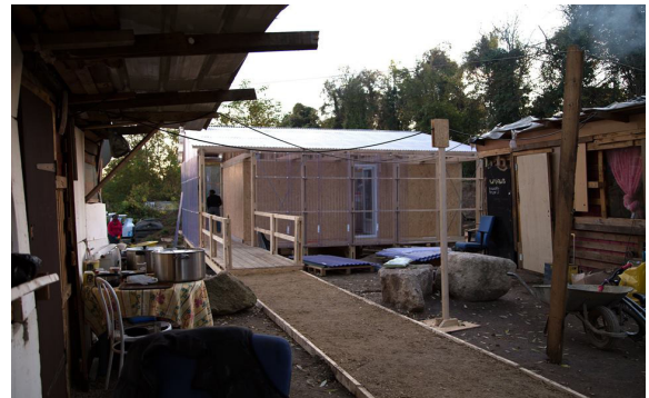
Cuisine partagée construite par les bénévoles de l'association en lien avec les habitants.

construits sur le site. Un accompagnement social des familles est mis en oeuvre.