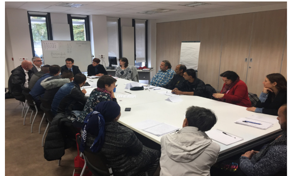
Réunion d'information collective du 13 octobre 2016.

Depuis le 8 novembre 2016, 14 personnes suivies par la plateforme AIOS (Adoma), adultes et jeunes de moins de 25 ans, sont actuellement en stage de formation à Stains. Il s'agit des premières traductions de l'accord avec Opcalia, qui permet notamment aux stagiaires de percevoir une rémunération prise en charge par Pôle emploi. L'équipe pédagogique de l'AFPA souligne la motivation et le sérieux des stagiaires.